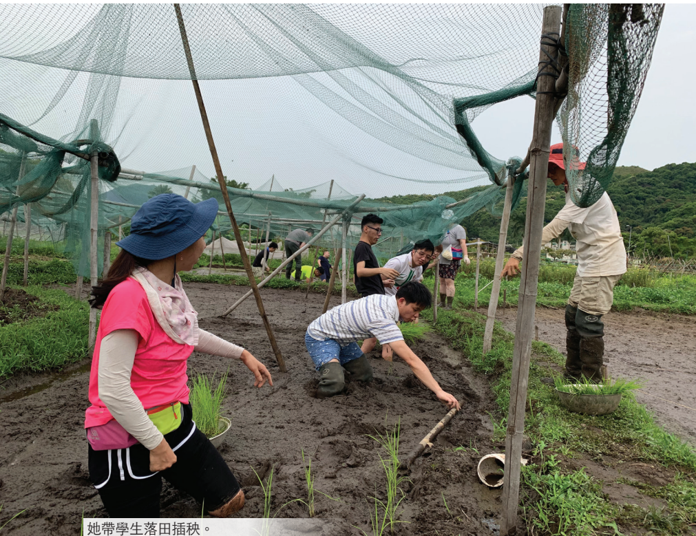
她帶學生落田插秧。

環保愛地球，是一種生活態度。只要在每天的生活裡有小小的改變，就能凝聚成為改變世界的力量。