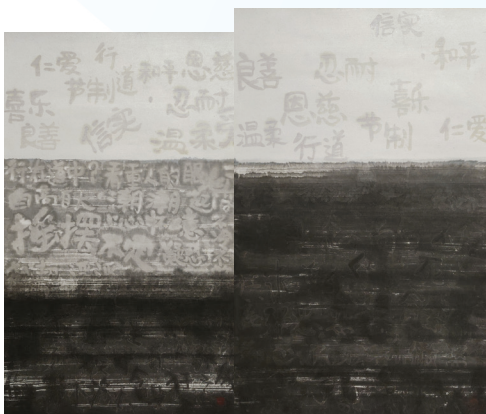
藝術家：范龍龍（中國） 題目：末世前，進入末世