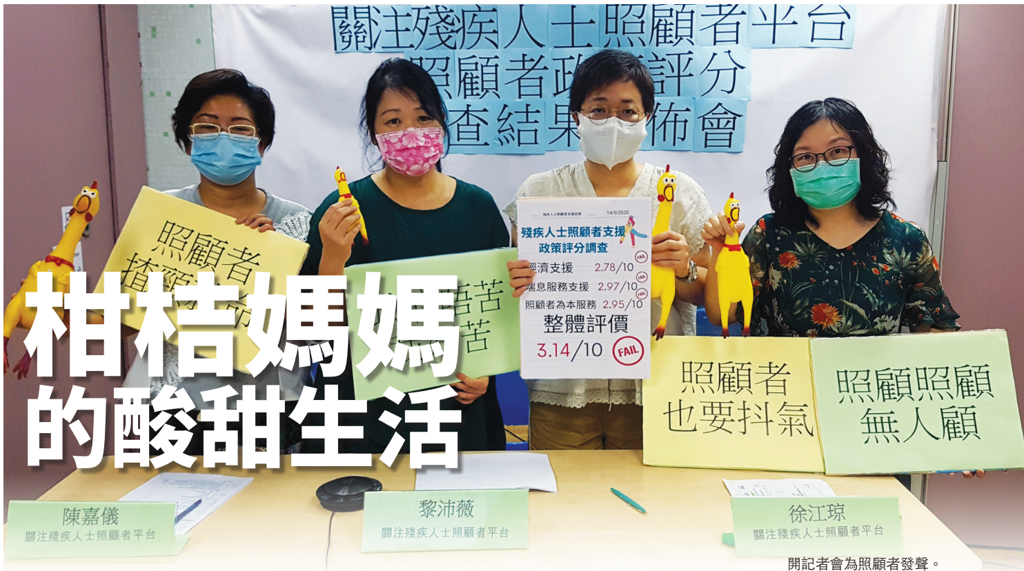
開記者會為照顧者發聲。

柑桔是橘子中最小的品種，外皮幼滑，口味甘甜，但有時也帶有一種水果的酸味，又酸又甜，令人印象難忘。