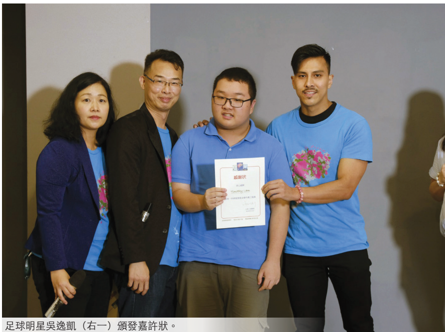
足球明星吳逸凱（右一）頒發嘉許狀。

回想起這些年來的柑桔人生，Macy說常常謹記《聖經》的一句話，是出於《以賽亞書》55章12至13節：「你們必歡歡喜喜而出來，平平安安蒙引導。……這要為耶和華留名，作為永不忘滅的證據。」她說：「神要我交出自己生命，引導我走祂的路。」柑桔媽媽是一條受苦的路，也是甘甜如蜜的路。