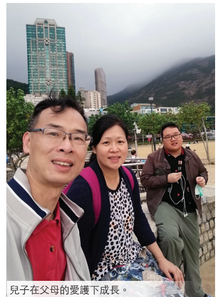
兒子在父母的愛護下成長。