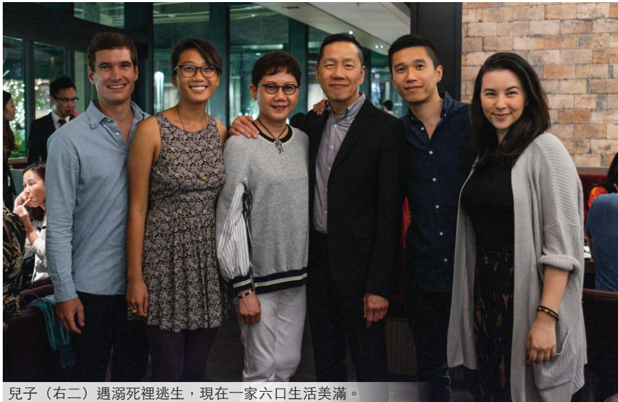
兒子（右二）遇溺死裡逃生，現在一家六口生活美滿。