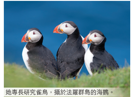
她專長研究雀鳥，攝於法羅群島的海鸚。

她猶記得老師曾跟她說：「其實你有這麼多事想做，你大可在大專教些兼職課程，先處理好自己的生活，再做想做的事情。」於是她去應徵，「今年是我在能仁書院教書的第六年，我很喜歡教育，今年教 Hong Kong Culture and Society 我帶出很多問題跟學生討論，其中有一堂講政治，我覺得我跟學生好似去了另外一個層次，在課堂的最後，我用了一張星星相作結：世界上每一個地方都有邪惡黑暗，每一個人都有人性的醜惡及美善，處處