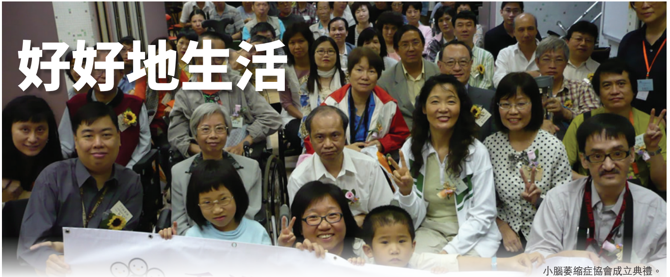
小腦萎縮症協會成立典禮。