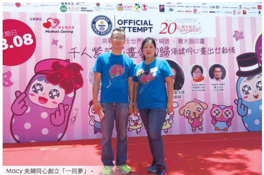
Macy 夫婦同心創立「一同夢」。

一樣痛苦，「有次和他去超市，別人問他一些問題，因為不識得應對，遭受取笑，回家便晚晚發惡夢。」