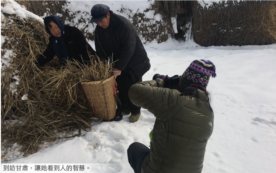
到訪甘肅，讓她看到人的智慧。