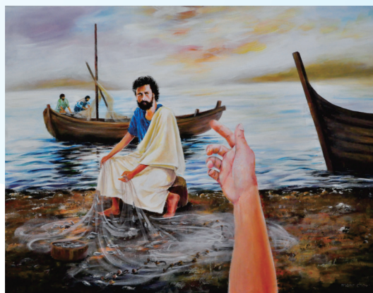
藝術家：周文志（香港） 題目：呼召