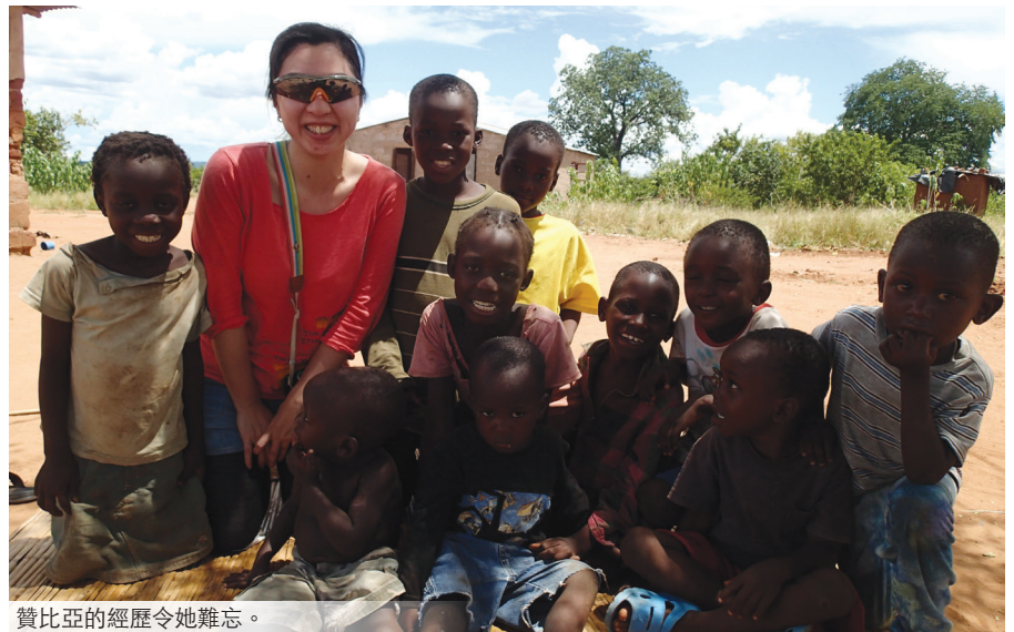
贊比亞的經歷令她難忘。

「贊比亞機程很遠，由香港飛去南非12個鐘頭，轉機再坐3、4個鐘，然後落機後立即坐6個鐘的