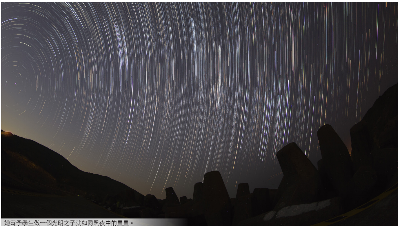
她寄予學生做一個光明之子就如同黑夜中的星星。

都可見到人性敗壞，黑暗得如同黑夜，我們無力把黑夜變成白晝。但天國的價值教導我們要做一個光明之子、做一個正直的人，就如同黑夜中的星星，我們就是做一顆光明之子，照亮不了世界，也能照亮身邊人。」她認為，每個生命都非常寶貴，「雖然我不知道自己可否跟年青人的生命同行，我亦不知道可否做到生命影響生命，但我想做生命教育，與他們一起成長。」這也成了她致力於教育，為了下一代，最深切的一份想望。