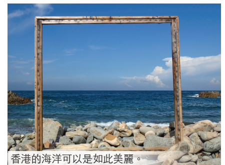
香港的海洋可以是如此美麗。