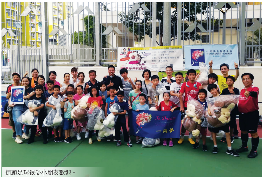
街頭足球很受小朋友歡迎。

2006年，Macy開始自發與同路家長舉辦訓練及活動，以助人自助的方式幫助自閉兒及特殊教育需要小童。她說：「『一同夢』最初是由街頭足球開始，感恩有好多教練幫手，包括足球員明星吳逸凱，希望能發掘這些小童的潛能，我們把足球改良為足球操，訓練小朋友肢體協調，我和丈夫也去學習體適能課程，幫手寫教材，舉辦興趣班吸引小朋友參加，透過足球鍛練紀律，很受歡迎，兒子都有參加和幫手。」