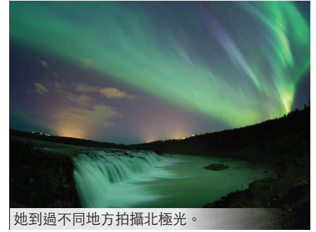
她到過不同地方拍攝北極光。

「上星期我帶學生落田插秧，插完之後，我向學生表示非常欣賞他們的付出。Appreciation在華人社會比較缺乏，多為家長式的教育，其實以前的我都是很多負面的情緒，只會埋怨，近幾年自己學習如何梳理。回頭望自己輕鬆了，看這個世界也不同了，現在Enjoy Life。」心態的改變，讓自己活得自在！「例如今天我食了一頓美味的午餐，我感恩，我有生命氣息享受美食。」她學會享受生命的每一天。